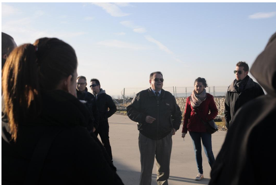
(docente y estudiantes comienzan la visita)

El pasado sábado, los/as estudiantes de Director de Seguridad, formación impartida por Aucal, realizaron una visita a un Campo de Formación y galería de Tiro, con el fin de poner en práctica los conocimientos adquiridos durante la formación en curso.